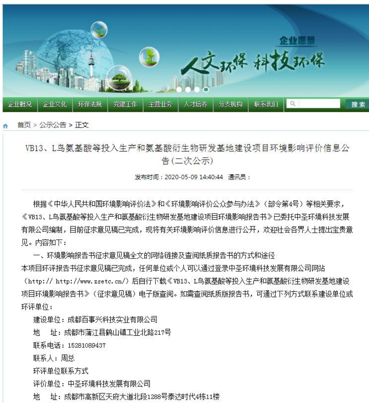
图2 环境影响评价公众参与第二次公示截图

本项目在环评单位网站上进行了第二次网络公示,时间为2020年5月9日~2020年5月21日(10个工作日)。网址为: http://www.zsetc.cn/index.php?m=content&c=index&a=show&catid=69&id=1640 。以下为网络公示截图: