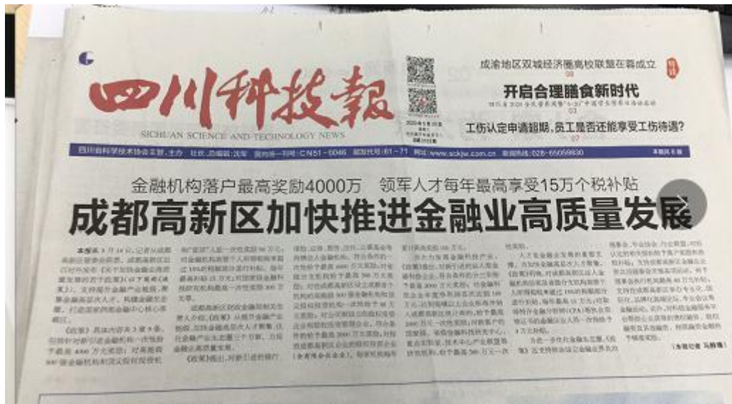
图7 四川科技日报第二次公示照片（表头）