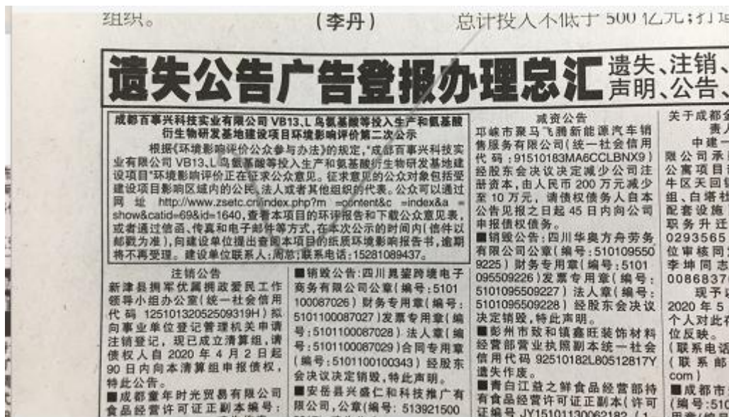
图8 四川科技日报第二次公示照片（位置）