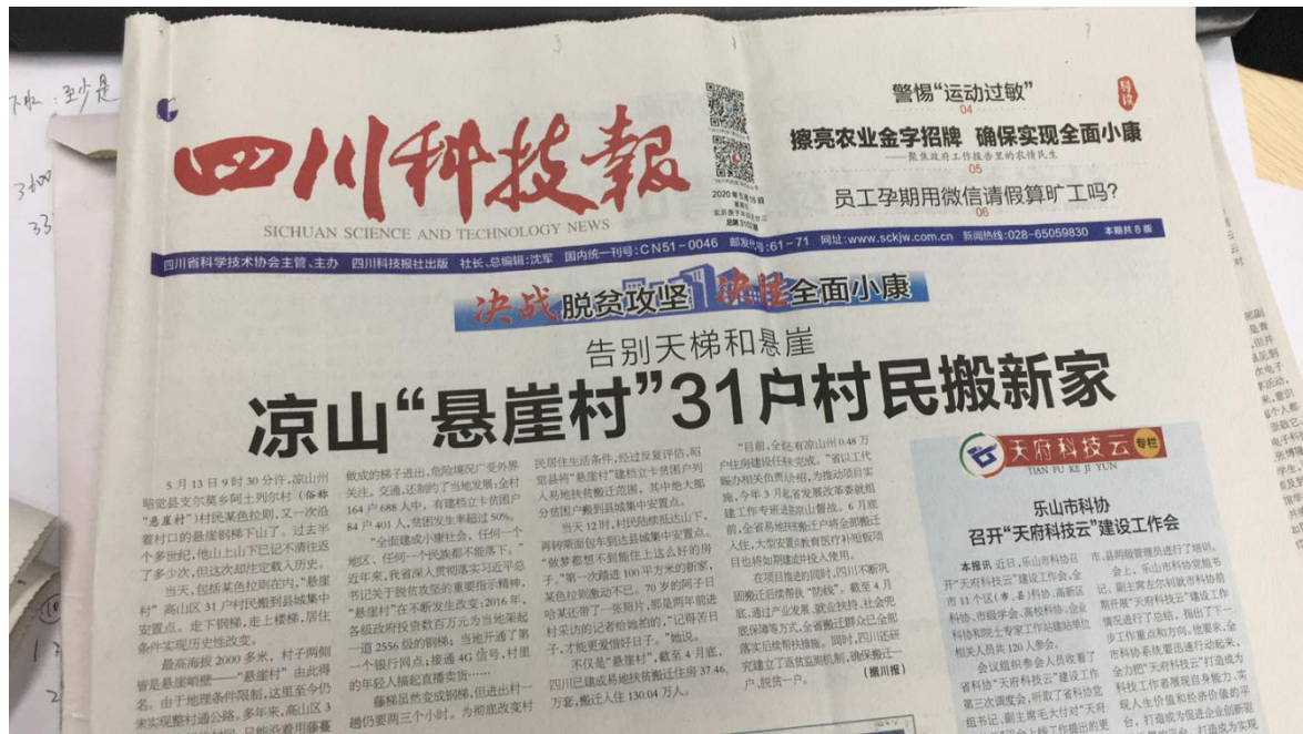
图5 四川科技日报第一次公示照片(表头)