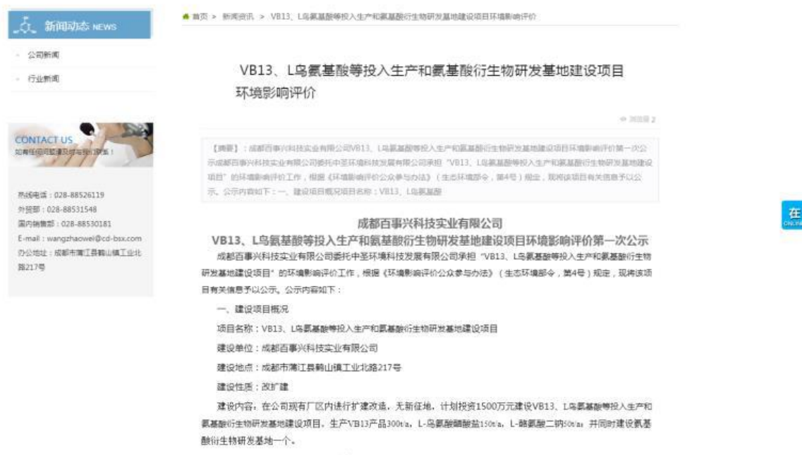
图 1 环境影响评价第一次公众参与信息公告截图